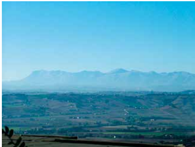
La catena dei Monti Sibillini, I monti azzurri

Si effettuano visite anche al vicino Santuario di Loreto.