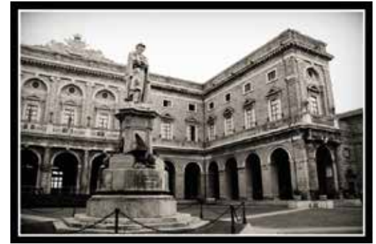
Piazza Giacomo Leopardi