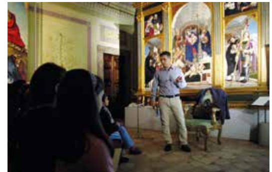
Leopardi spiegato ai bambini

Natura umana, or come, se frale in tutto e vile, se polve ed ombra sei, tant'alto senti?