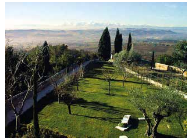
Vista dal colle dell’Infinito

Il percorso prevede una passeggiata nei luoghi resi immortali dalla sua poesia - dalla Piazzuola del Sabato del Villaggio, al Colle dell’Infinito, dalla Torre del passero solitario, alla piazza della Torre del borgo - scandita dalla lettura di alcuni testi significativi.